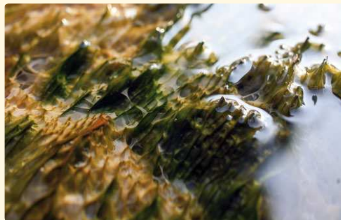
ALGA ETS 05 ( Euganean Thermal Spring )

È sufficiente rivolgersi al proprio medico di famiglia e richiedere una ricetta con prescrizione "fanghi e bagni terapeutici".